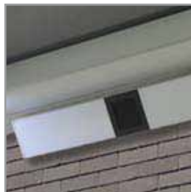
MUSIQUE DANS LE MODULE BEAM