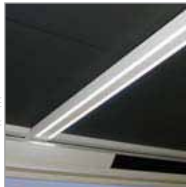
LAGUNE® MODULE LIGHT