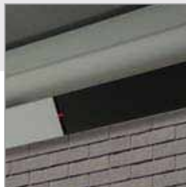
CHAUFFAGE DANS LE MODULE BEAM