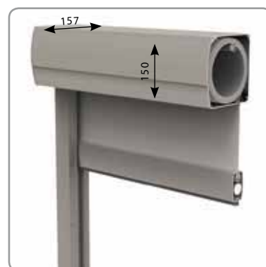
Coupe du Fixscreen® 150 (F)