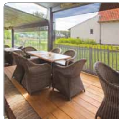
Fenêtre crystal intégrée dans la toile en fibre de verre